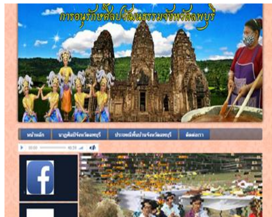
รูปที่ 2 เว็บไซต์การอนุรักษ์ศิลปวัฒนธรรมจังหวัดลพบุรี