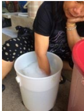
รูปที่ 2 ผสมส่วนผสมให้เป็นเนื้อเดียวกัน