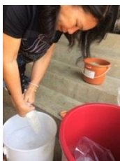
รูปที่ 1 เติมน้ำผสม