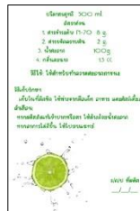
รูปที่ 9 พัฒนาเครื่องหมายและฉลากผลิตภัณฑ์ทำความสะอาดภาชนะที่ใช้ในครัวเรือน