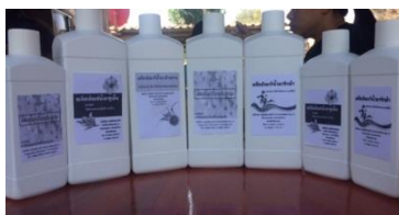
รูปที่ 17 ต้นแบบชุดผลิตภัณฑ์ทำความสะอาดเพื่อเข้าสู่มาตรฐานผลิตภัณฑ์ชุมชน (.มผช.)

3.4 ด้านหลักเกณฑ์และข้อปฏิบัติตามมาตรฐานผลิตภัณฑ์ชุมชน (มผช.) ยังไม่เป็นตามเกณฑ์ มาตรฐานที่กำหนดขึ้น จึงไม่สามารถขอรับมาตรฐานผลิตภัณฑ์ชุมชนได้ เนื่องจากยังขาดทุนสนับสนุน ในการจัดสถานที่ เฉพาะสำหรับการผลิต ขาดเครื่องมือ อุปกรณ์เฉพาะสำหรับการผลิต