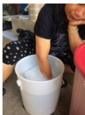
รูปที่ 2 ผสมส่วนผสมให้เป็นเนื้อเดียวกัน