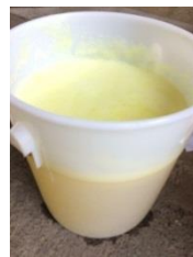
รูปที่ 3 ผลิตภัณฑ์ที่ทำเสร็จ