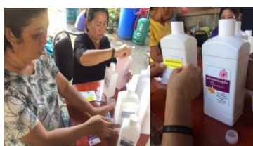
รูปที่ 16 ติดฉลากหรือตราผลิตภัณฑ์