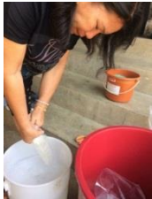
รูปที่ 1 เติมส่วนผสม