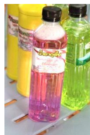
รูปที่ 5 น้ำยาล้างจาน (ชื่อเดิม)