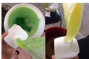
รูปที่ 15 พัฒนาบรรจุภัณฑ์ในภาชนะที่เหมาะสม