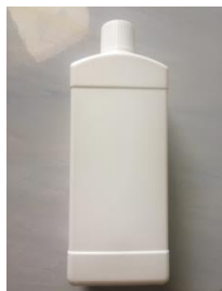
รูปที่ 12 พัฒนาภาชนะบรรจุ

3.2 การพัฒนาต้นบรรจุภัณฑ์ตามมาตรฐานผลิตภัณฑ์ชุมชน ทั้ง 3 ผลิตภัณฑ์ที่ได้โดยบรรจุในภาชนะที่สะอาด เหมาะสม ปิดได้สนิท ไม้รั่ว ไม้แตก สามารถป้องกันการปนเปื้อนจากสิ่งภายนอกได้