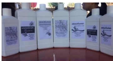
รูปที่ 17 ต้นแบบชุดผลิตทำความสะอาดเพื่อเข้าสู่มาตรฐานผลิตภัณฑ์ชุมชน (.มผช.)

3.4 ด้านหลักเกณฑ์และข้อปฏิบัติตามมาตรฐานผลิตภัณฑ์ชุมชน (มผช.) ยังไม่เป็นตามเกณฑ์ มาตรฐานที่กำหนดขึ้น จึงไม่สามารถขอรับมาตรฐานผลิตภัณฑ์ชุมชนได้ เนื่องจากยังขาดทุนสนับสนุน ในการจัดสถานที่ เฉพาะสำหรับการผลิต ขาดเครื่องมือ อุปกรณ์เฉพาะสำหรับการผลิต