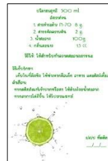
รูปที่ 9 พัฒนาเครื่องหมายและฉลากผลิตภัณฑ์ทำความสะอาดภาชนะที่ใช้ในครัวเรือน