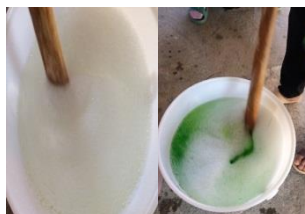
รูปที่ 14 การผสมส่วนผสม