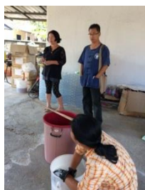
รูปที่ 13 รับคำแนะนำจากผู้เชี่ยวชาญ

รูปภาพ กระบวนการพัฒนาชุดผลิตภัณฑ์ทำความสะอาด