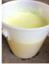
รูปที่ 3 ผลิตภัณฑ์ที่ทำเสร็จ