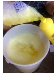
รูปที่ 4 บรรจุลงในขวดภาชนะ