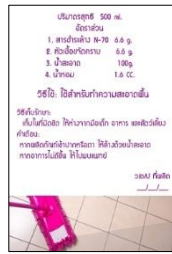
รูปที่ 10 พัฒนาเครื่องหมายและฉลากผลิตภัณฑ์ทำความสะอาดพื้น