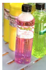
รูปที่ 5 น้ยาล้างจาน (ชื่อเดิม)