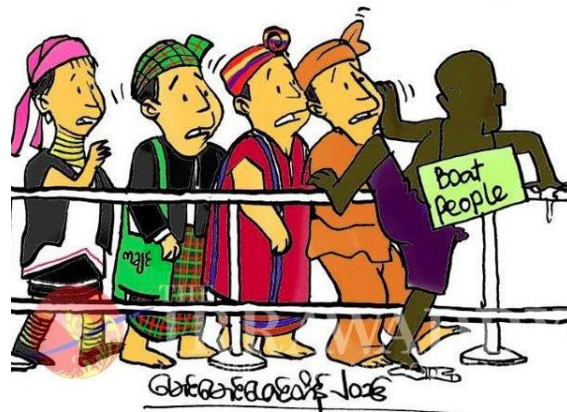
รูปที่ 1 การ์ตูน “Boat People”

สาเหตุที่ผู้วิจัยสนใจศึกษาประเด็นโรฮิงญาในการ์ตูนการเมือง เนื่องจากผู้วิจัยมีความสนใจเกี่ยวกับประเด็นอาเซียนและการ์ตูนการเมืองเป็นพิเศษ และเมื่อได้ทำการวิเคราะห์เนื้อหาจากการ์ตูนการเมืองในหนังสือพิมพ์ไทยที่มีการนำเสนอประเด็นอาเซียนอย่างสม่ำเสมอ ได้แก่ เดอะ เนชั่น (The Nation) และบางกอกโพสต์ (Bangkok Post) ก็พบว่าในปี พ.ศ. 2558 มีการนำเสนอประเด็นเกี่ยวกับโรฮิงญามากที่สุด จำนวน 25 ชิ้น จากกลุ่มตัวอย่างการ์ตูนการเมืองอาเซียนทั้งหมด 68 ชิ้น (คิดเป็นร้อยละ 36.7) นอกจากนี้ประเด็นโรฮิงญาเป็นประเด็นที่มีความทับซ้อนกันหลายมิติ ทั้งในแง่ของสิทธิมนุษยชน ชนกลุ่มน้อย ผู้อพยพ อัตลักษณ์ ศาสนา ดินแดน และความสัมพันธ์ระหว่างประเทศ [3] [4] [5] [6] โดยมีประเทศอาเซียนหลายประเทศที่เข้ามามีบทบาทพัวพันในกรณีปัญหาโรฮิงญา ได้แก่ประเทศต้นทางอย่างเมียนมา ประเทศกลางทางอย่างไทย มาเลเซีย อินโดนีเซีย รวมทั้งประเทศฟิลิปปินส์ และสิงคโปร์ [7] [8]