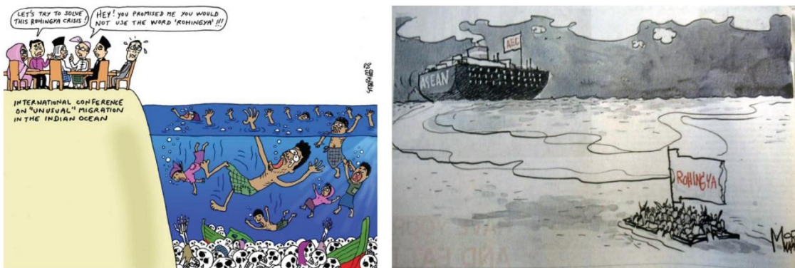
รูปที่ 4 ตัวอย่างภาพตัวแทนที่สะท้อนภาพความเป็นคนชายขอบของชาวโรฮิงญา

การ์ตูนนิสต์แทบทุกรายได้นำเสนอประเด็นปัญหาของชาวโรฮิงญาด้วยภาพตัวแทนเชิงนามธรรมว่าชาวโรฮิงญาตกเป็น “เหยื่อค้ำมนุษย์” มากที่สุด โดยผลงานทั้ง 8 ชิ้นปรากฏในปี พ.ศ. 2558 ซึ่งเป็นช่วงเวลาที่มิกระแสข่าวปัญหาการค้ำมนุษย์โรฮิงญาในพื้นที่ภาคใต้ และมีการ์ตูน 6 ชิ้นที่ได้ส่งสารเรียกร้องให้มีการช่วยเหลือชาวโรฮิงญา โดยการสร้างภาพแทนว่าพวกเขาเป็น “ผู้รอคอยความช่วยเหลือ” และ “ผู้ขอความช่วยเหลือ”