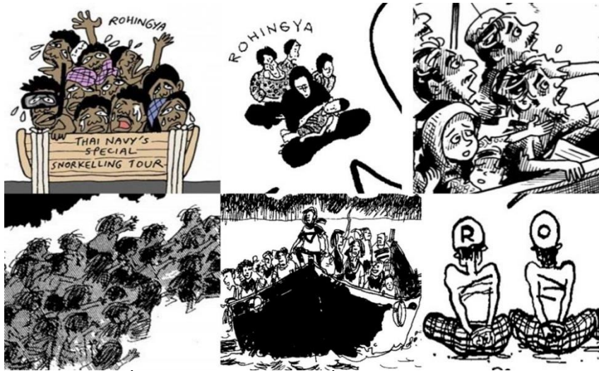
รูปที่ 2 ตัวอย่างภาพตัวแทนโรฮิงญาที่ใช้รูปสัญลักษณ์ “ชาวโรฮิงญา”