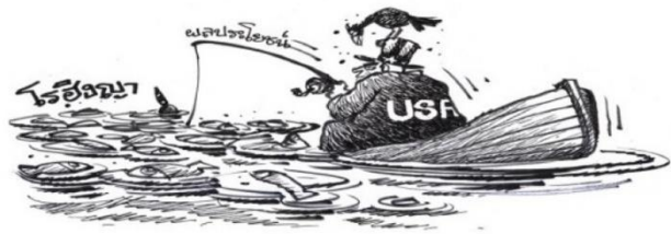
รูปที่ 5 ตัวอย่างภาพตัวแทนโรฮิงญาที่ถูกถ่ายทอดออกมาในด้านลบ

อีกประเด็นหนึ่งที่น่าพิจารณา ได้แก่ ภาพแทนเชิงนามธรรมที่ปรากฏในการ์ตูนโรฮิงญาเหล่านี้สะท้อนแนวคิดเรื่องการเมืองเชิงพื้นที่อย่างไร ดังที่ได้กล่าวไปแล้ว ในภาพรวมมีการสร้างภาพตัวแทนชาวโรฮิงญาว่าเป็น “คนชายขอบ” ทั้งในแง่บวกและลบ และการ์ตูนบางชิ้นได้สะท้อนภาพของการถูกทำให้ไม่มีตัวตนอย่างชัดเจน โดยเฉพาะชิ้นที่ 28 ของชัย ราชวัตร ที่ชาวโรฮิงญาถูกกล่าวถึงว่าเป็น “วิญญาณ” ที่มาถามหาความยุติธรรมจากเจ้าหน้าที่ที่พัวพันกับการค้ามนุษย์ หรือชิ้นที่ 65 ของสเตฟี่ ที่รูปสัญลักษณ์ชาวโรฮิงญาถูกเหยียบย่ำโดยผู้นำไทย-เมียนมา พร้อมด้วยคำกล่าวของนางซูจีว่า “ไม่มีชาวโรฮิงญา” (There is no Rohingya...) ซึ่งสะท้อนภาพการกดทับอัตลักษณ์จากประเด็นข่าวที่รัฐบาลเมียนมาหลีกเลี่ยงการใช้คำว่าโรฮิงญาเรียกชนกลุ่มน้อยมุสลิมในเมียนมา