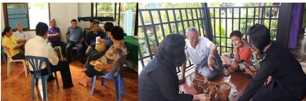
ภาพที่ 12 การวิเคราะห์หาแนวทางในการพัฒนาผลิตภัณฑ์เครื่องจักสานร่วมกับผู้จักสาน

จากการศึกษาข้อมูลผลิตภัณฑ์ดังกล่าว ผู้วิจัยร่วมกับผู้จักสานในชุมชนร่วมกันวิเคราะห์หาแนวทางในการพัฒนาผลิตภัณฑ์ รวมทั้งความต้องการของตลาด และคัดเลือกผลิตภัณฑ์ที่พัฒนาและยกระดับ พร้อมทั้งประเมินความพึงพอใจอยู่ในระดับดี คือ ตะกร้า(ข้าวหวด) นำมาพัฒนาเป็นผลิตภัณฑ์ที่ใช้ประโยชน์ได้หลากหลายแต่ยังคงเอกลักษณ์ดั้งเดิม คือ โคมไฟ ฝาชี พัฒนาโดยจักเส้นตอกให้มีความสม่ำเสมอ เส้นเรียบไม่มีขุยและผลิตภัณฑ์ที่ได้มีความคงทน มีอายุการใช้งาน ไม่เกิดเชื้อราและไม่มีตัวมอด