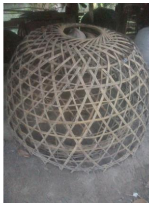
ภาพที่ 2 ส้มไก่

“...ตาอยู่บ้านจะปลูกผักปลอดสารพิษกินเอง ค่าใช้จ่ายในบ้านก็บ่ามีอะหยังถ้าว่างๆ ช่วงบ่าได้ไปสวน ตาก็ไปตัดเอาไม้ไผ่หลังบ้านมา 1 เล่ม นำมาผ่าแล้วริดเอาตาออก จักเป็นเส้นเอามาสานเป็นส้มไก่ แซะ ดึงวันนี้ก็มีรายได้เพียงพอต่อค่าใช้จ่าย อยู่อย่างนี้ก็มีความสุขแล้วในบั้นปลายของชีวิต...”