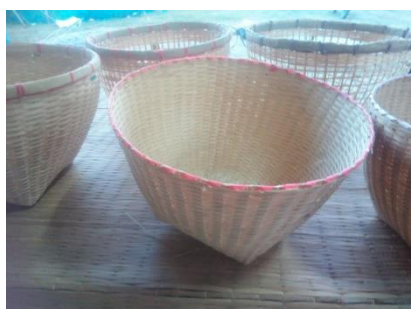
ภาพที่ 5 ตะกร้า (ซ้าหวด)