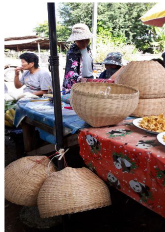
ภาพที่ 11 ตะกร้า(ข้าวหวด) วางขายในตลาด