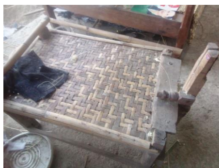
ภาพที่ 4 เครื่องเรียงเส้นตอก