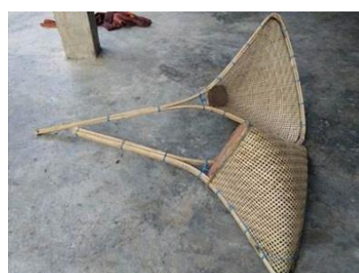
ภาพที่ 6 ซะะ