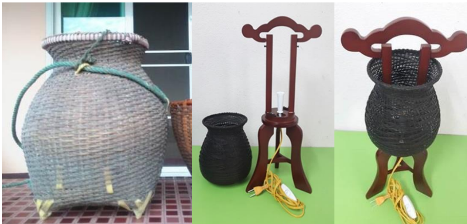
ภาพที่ 14 โคมไฟจากช่อง