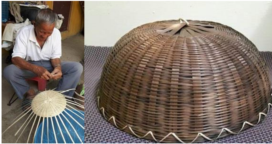
ภาพที่ 15 ฝาชีครอบอาหารที่ผ่านกระบวนการควั่น