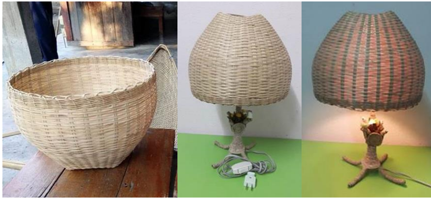
ภาพที่ 13 โคมไฟจากตะกร้า(ข้าวหวด)

2. ฝาชีครอบอาหาร เป็นผลิตภัณฑ์เพื่อป้องกันฝุ่นผงและแมลงต่างๆ เป็นการผลิตขึ้นเพื่อตอบสนองต่อความต้องการของมนุษย์ในด้านการเก็บรักษาอาหารให้สะอาดไม่มีสิ่งสกปรก ในปัจจุบันสามารถพบการใช้ฝาชีเป็นจำนวนมาก เพราะเป็นวัสดุจากธรรมชาติและหาซื้อได้ง่ายไม่ทำลายสิ่งแวดล้อมให้เสียหาย สามารถผลิตจำหน่ายในราคาใบละ 150 บาท