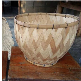
ภาพที่ 9 หนึ่งข้าวจากไม้ไผ่

“...อยู่ทำเครื่องจักสานมาหลายปีละ และก็ทำเอาใจเอง พร้อมทั้งนำไปขาย ชั้นงานดีที่สุดในที่สุดก็คือ ข้าวหวด (ตะกร้า) เพราะว่าแต่ละบ้านเป็นจะนิยมใจเพื่อนำไปหวดข้าวสารเหนียวเพื่อสื่อเม็ดข้าว น้ำหยัด (สะเด็ดน้ำ)....”