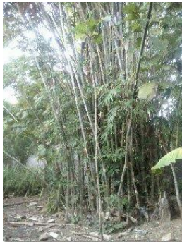
ภาพที่ 8 กอไม้ไผ่